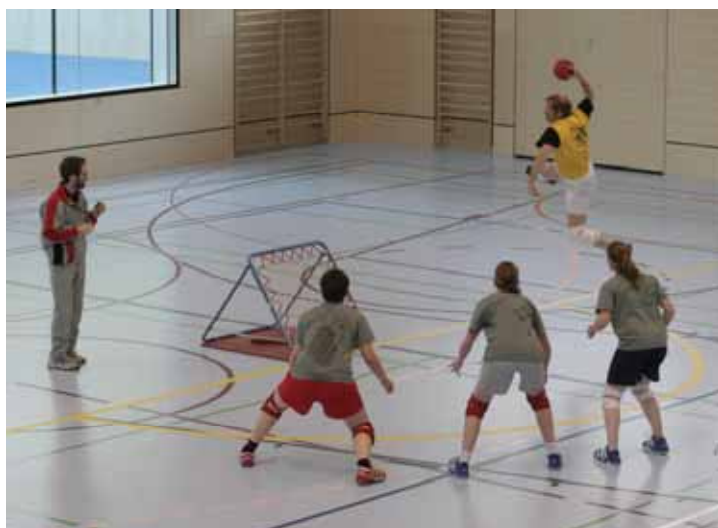
Neuchâtel face à l'équipe suisse féminine lors de la finale 2006