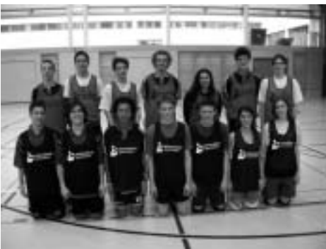
Les joueurs M18

Il y a tout d'abord le sport scolaire qui occupe une place importante dans nos activités, par exemple à travers des initiations dans les classes et la formation de maîtres d'éducation physique. Il y a ensuite les entraînements et tournois des clubs qui forment l'épine dorsale des activités proposées aux juniors. Mais la FSTB s'engage également en fournissant à nos jeunes sportifs des possibilités supplémentaires de pratiquer le tchoukball.