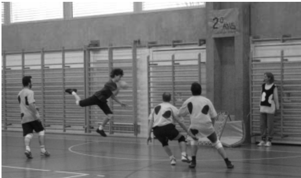
L'équipe bleue (Fribourg et Jura) en défense

Les moments de repos passés sur le banc ont permis de discuter des us et coutumes et tactiques des différents clubs. Signalons qu'en parallèle se déroulait un tournoi junior M15 remporté par une équipe de