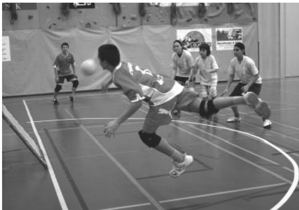
Les M15 lors du tournoi de Fribourg