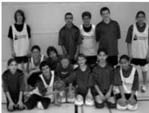
Les joueurs M15